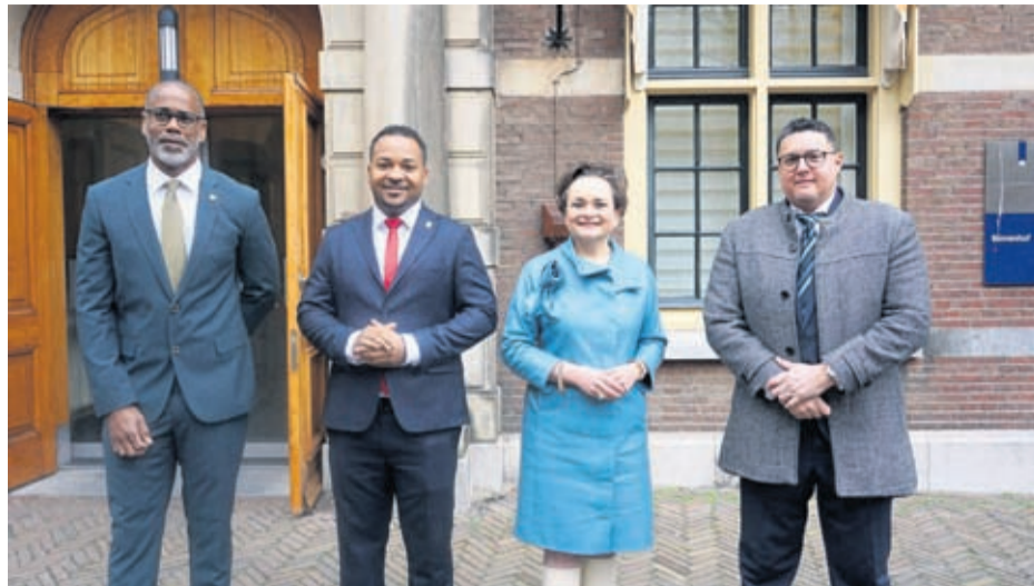
“Esaki tambe ta bay dura su tempo pasobra nos mester discuti esaki exhaustivamente”, el a bisa. Negociacionnan cu e paisnan ta bay tuma lugar na momento cu e Secretario di Estado bishita e islanan na mei y juni proximo. Van Huffelen a

E Secretario di Estado a splica cu despues di esey, e ta bay sinta cu e paisnan pa papia tocante e respuesta na e preguntanan cu a keda presenta.